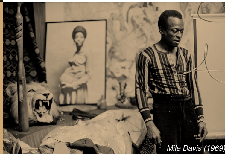
Miles Davis (1969)

Vous avez sans doute visité l'exposition Golden Sixties, installée aux Guillemins depuis plusieurs mois déjà. Dans le cadre de cet hommage aux années '60 (qui ne furent pas 'golden' pour tout le monde), la Maison du Jazz vous propose deux soirées vidéos ancrées dans cette décennie bouillonnante. La première évoquera les doutes et les virulences d'un jazz qui se cherche, un jazz auquel le rock enlève petit à petit son public, un jazz qui se radicalise au risque de devenir une musique pour happy fews. Du classicisme bon teint d'un middle jazz encore vert, aux débordements salubres d'un free-jazz velleitaire, du hard-bop funky de Messengers au look changeant aux premiers apôtres d'un jazz plus électrique, c'est tout un univers musical mais également sociologique qui sera dévoilé sur l'écran de la Maison du Jazz, avec en toile de fond tous ces événements que nous rappelle l'exposition Golden Sixties. Miles Davis, John Coltrane, Charles Mingus, Bill Evans, Archie Shepp, Louis Armstrong, Duke Ellington, Ella Fitzgerald, Abbey Lincoln et bien d'autres seront au rendez-vous. You too.